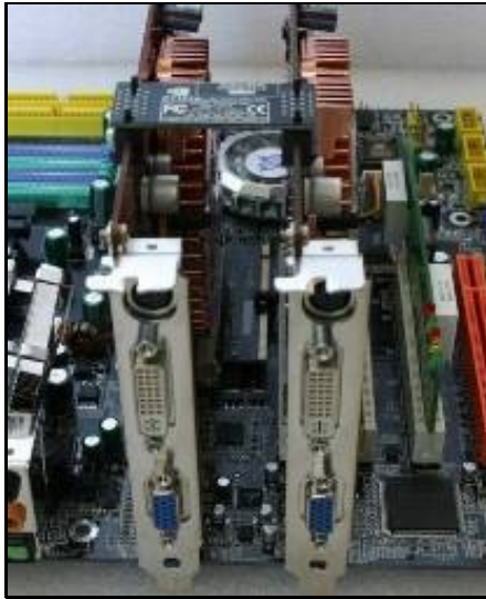
CrossFire de ATI