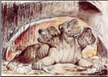
O Can Cerberos