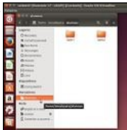
O marcador a Alumnos.

Na seguinte imaxe podemos ver o efecto na sesión dun usuario profesor/a, co acceso que se creou grazas ao script: